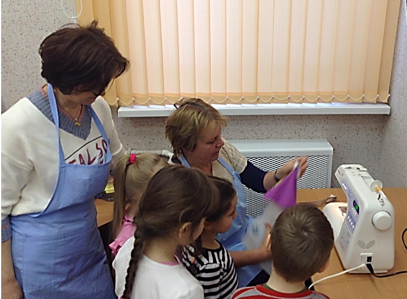
КАСТЕЛЯНША И ПЕДАГОГ