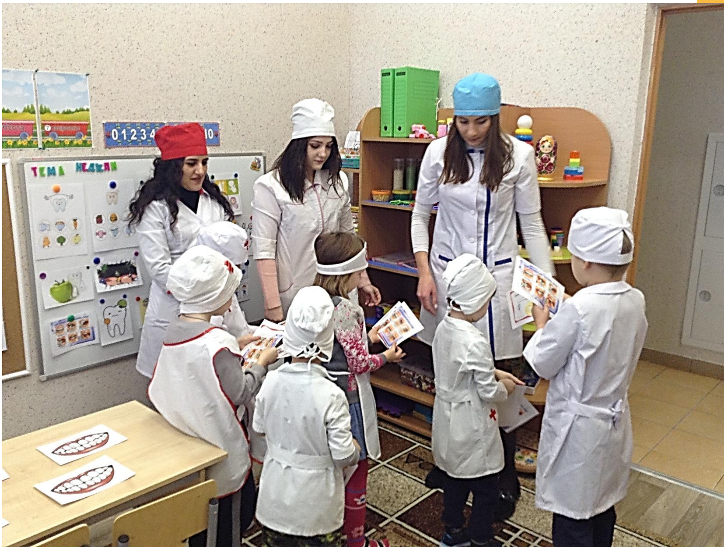
СТУДЕНТЫ МЕДКОЛЛЕДЖА И ПЕДАГОГ