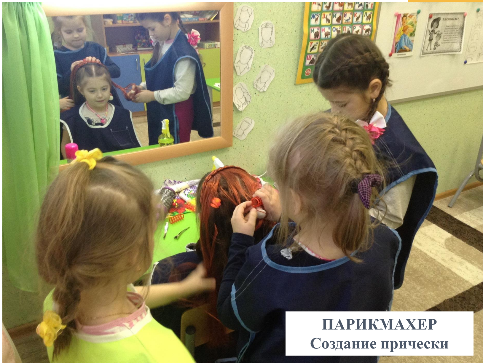
ПАРИКМАХЕР Создание прически