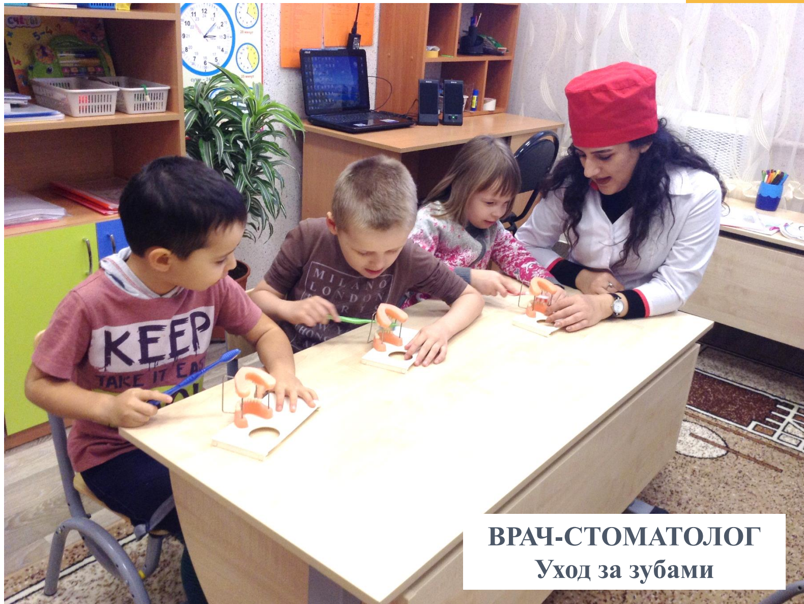
ВРАЧ-СТОМАТОЛОГ Уход за зубами