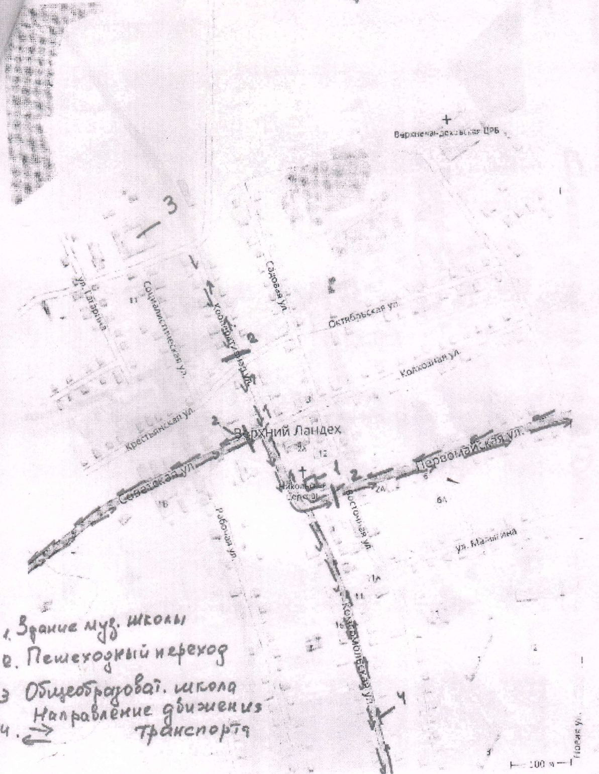
Схема организации дорожного движения