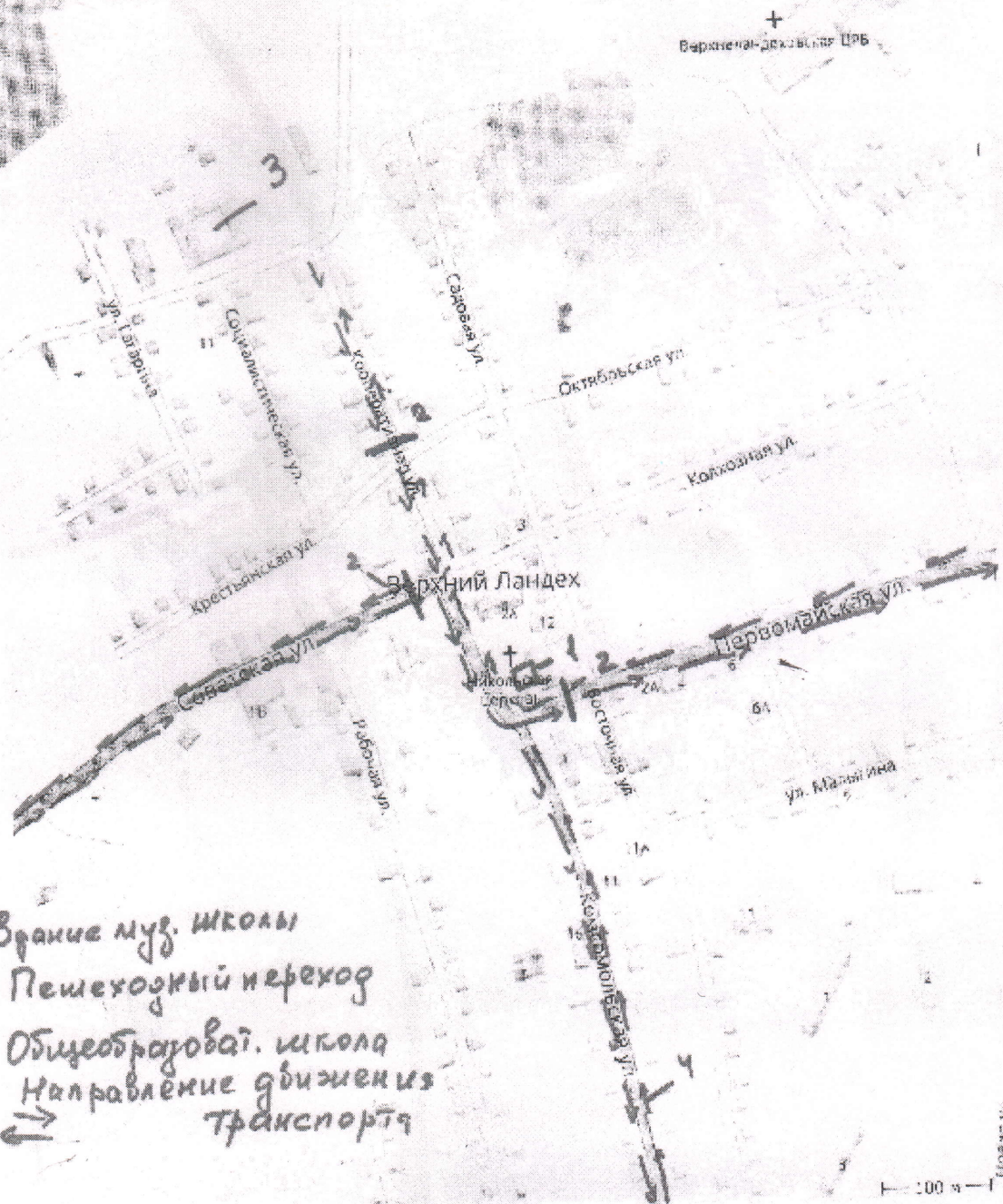
Схема организации дорожного движения