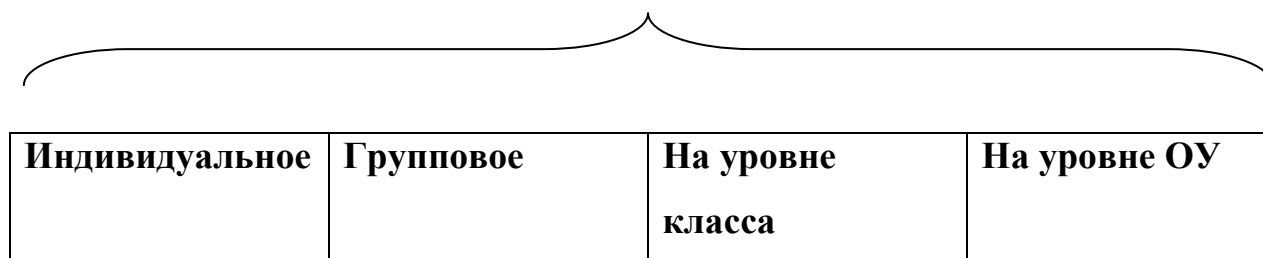
Основные формы сопровождения